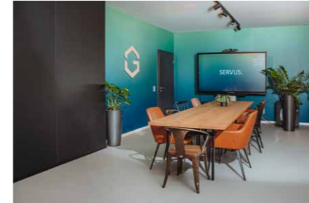
GreG Freyung-Grafenau Grafenauer Straße 22 | 94078 Freyung www.greg.bayern/frm