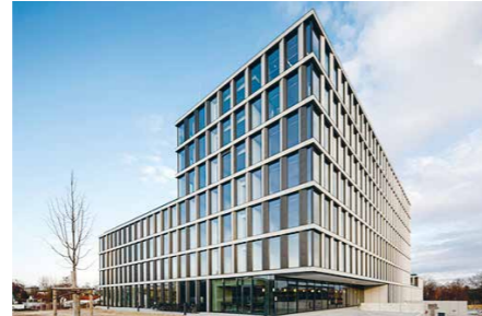
TechBase Franz-Mayer-Straße 1 | 93053 Regensburg www.techbase.de