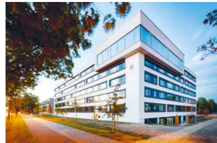
Landratsamt Regensburg Altmühlstraße 3 | 93059 Regensburg www.landratsamt-regensburg.de