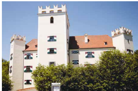
Schloss Mariakirchen Obere Hofmark 3 | 94424 Arnstorf www.hans-lindner-stiftung.de