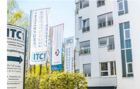
ITC1 Deggendorf Technologie orientierter Gewerbepark und digitales Gründerzentrum Ulrichsberger Str. 17 | 94469 Deggendorf www.itc-deggendorf.de