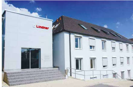
Hans Lindner Stiftung Hans Lindner Regionalförderung Schulungszentrum Aufhausener Straße 3 | 94424 Arnstorf www.hans-lindner-stiftung.de info@hans-lindner-stiftung.de