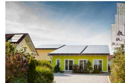
Seminarhaus Gruber Am Thannenmais 16a | 94419 Reisbach www.seminarhaus-gruber.de